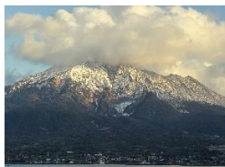
最近見た雪化粧の桜島